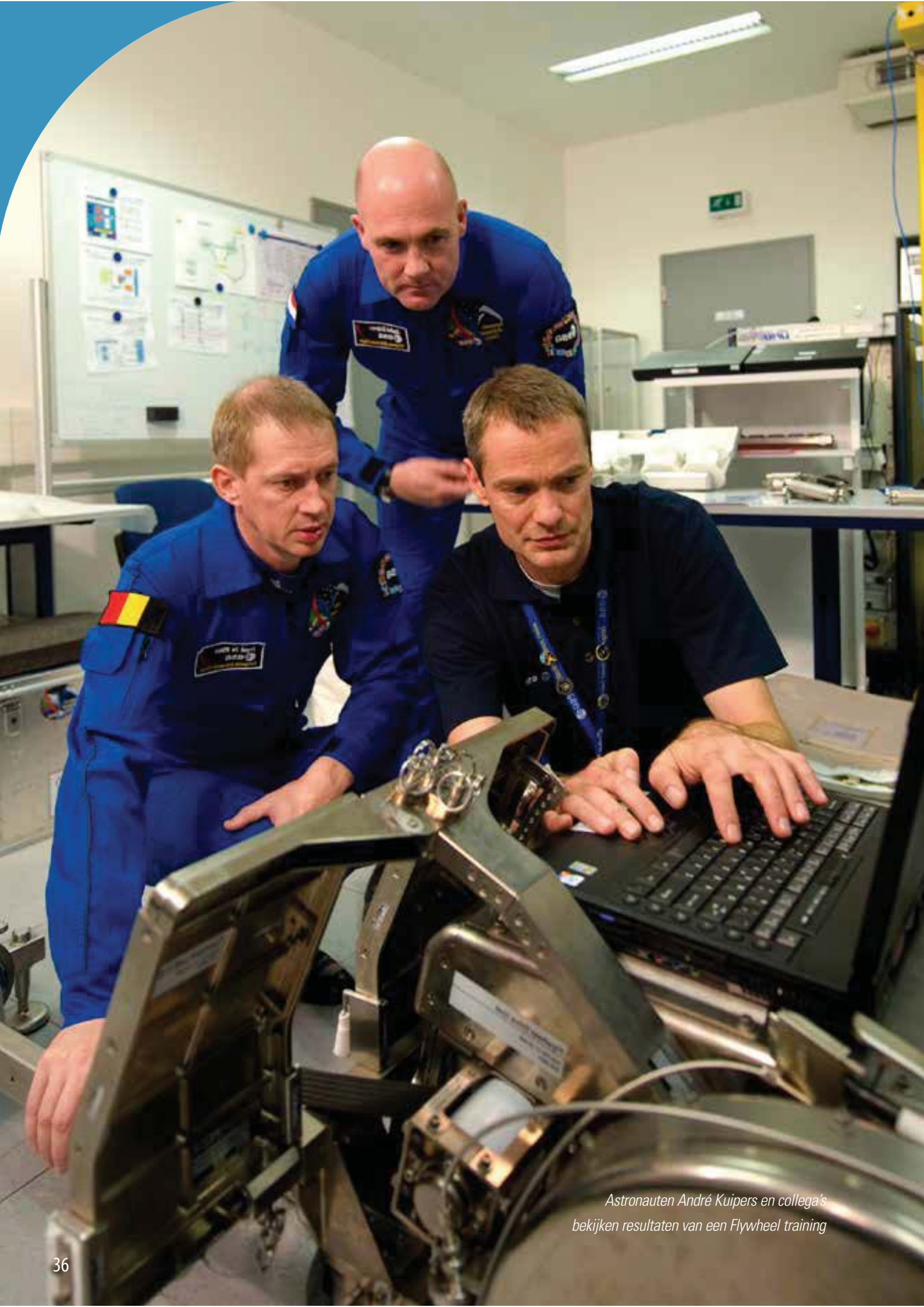
Astronauten André Kuipers en collega's bekijken resultaten van een Flywheer training